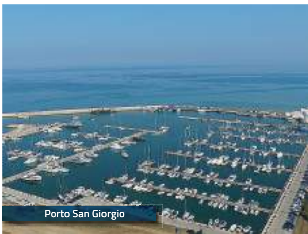
Porto San Giorgio