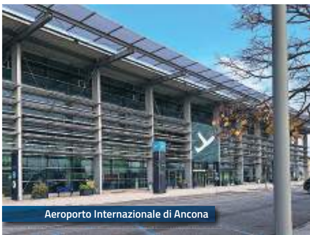
Aeroporto Internazionale di Ancona